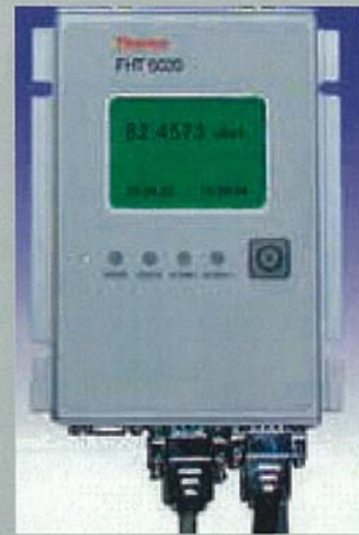
小型のコントロールユニットに高性能を凝縮 外形 (H, W, D) : 182mm×130mm×66mm