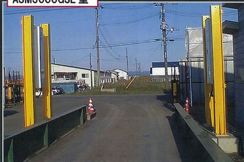
検出部外形 (H×W×D) 寸法 : 1829mm×457mm×254mm