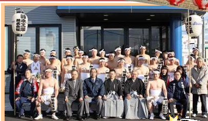
出発前に記念撮影