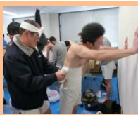
力を合わせて準備します!