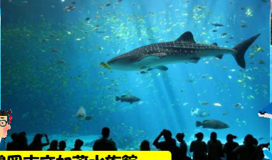
鶴岡市立加茂水族館

クラゲの展示種類(35種類以上)は世界一を誇り 展示数でギネスに認定されております♪眼下に広がる 日本海を眺め、クラゲに癒されのんびりしたいですね。