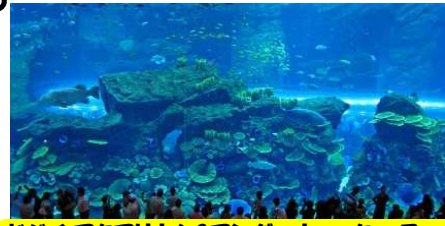
ドバイアクアリウム&アンダーウォーターズー Dubai Aquarium & Underwater Zoo

今回ののはしやすめは「水族館」 仙台うみの杜水族館も7月1日開園しましたね！ 子どもはもちろん、家族で夫婦で恋人と…はもちろんですが、仕事で身体も心も疲れたサラリーマンが クラゲに癒されに年間パスポートを購入して日々通ってもいいじゃないですか…そんな素敵水族館♡