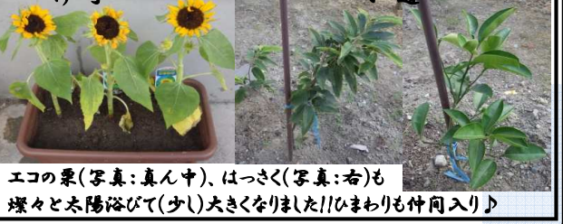
エコの粟(写真:真ん中)、はっさく(写真:右)も 燦々と太陽浴びて(少)大きくなりました!! ひまわりも仲間入り♪

さあ、初夏から夏の釣りといえばシーバスです! シーバスとはスズキの事なんですけど、スズキは出世魚としては有名ですね。一般的に40cmまでが「セイゴ」40cm～60cmまでが「フッコ」60cm以上が「スズキ」と呼ばれています。これらを海のアングラーはシーバスと呼んでいます。 ルアーフィッシングでお馴染みのブラックバスに、スズキの釣り方・習性が似ていることから、海のバス=シーバス(seabass)と呼ばれるようになりました。私も最近、シーバス釣りを始めたばかりです。様々な情報誌やネットで釣り方を勉強して河口付近を中心に釣りをしています。休みの日の早朝に名取川河口へ出向きひたすらルアーを投げてみました。表層→中層→底をテンポ良くルアーを泳がせます。早くしてみたり遅くしてみたり…。ちなみに使っているルアーはこちら→正直、何色が良いのかつかれるのかわかりません…。